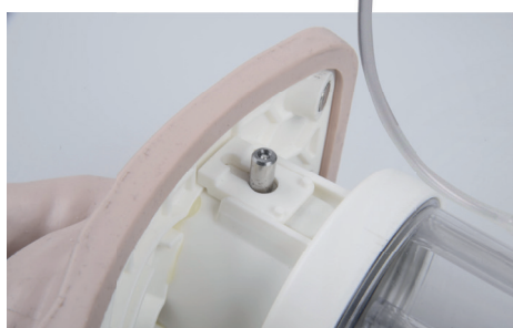
模拟不同程度前列腺病变